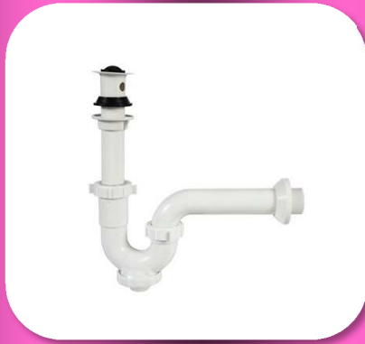
02-043 TRAMPA PARA LAVABO CON REGISTRO *BULTO 40 PIEZAS $48.60