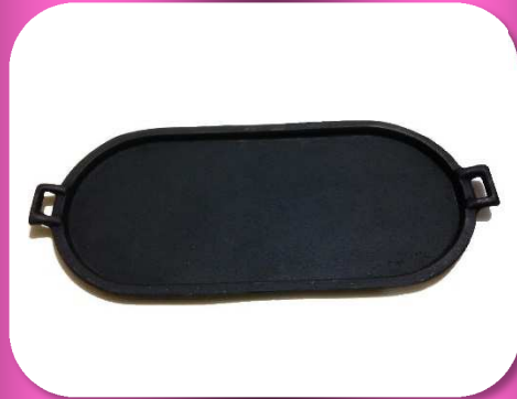
02-135 COMAL OVALADO DE FIERRO VACIADO 18" *CAJA C/10 $203.00