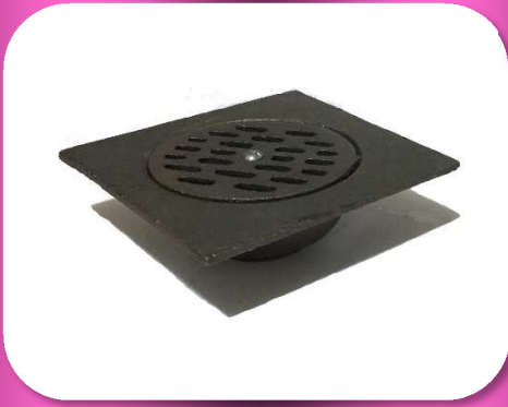
02-056 RESUMIDERO DE FIERRO VACIADO #6 COMPLETO *CAJA C/30 $65.00