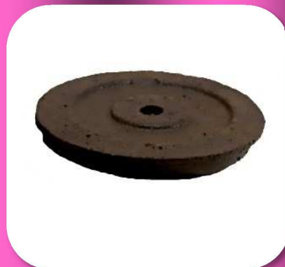
02-014 TAPA DE REGISTRO PARA BANQUETA DE FIERRO VACIADO $16.50