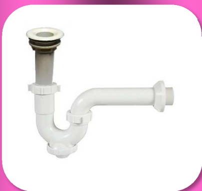
02-042 TRAMPA PARA FREGADERO CON REGISTRO *BULTO 40 PIEZAS $48.60