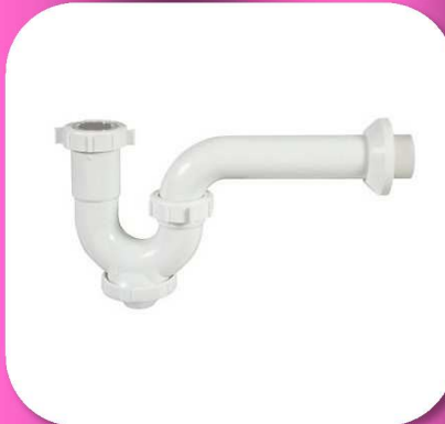
02-047 MEDIA TRAMPA PARA LAVABO O FREGADERO CON REGISTRO *BULTO 60 PIEZAS $36.20