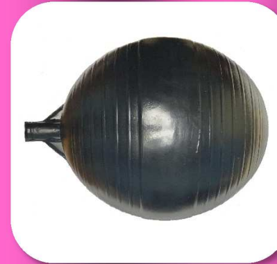
02-186 FLOTADOR 6" PARA TINACO DE PLASTICO COLOR NEGRO *BULTO 70 PIEZAS $12.95