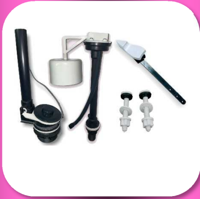
02-180 JUEGO DE HERRAJE PARA W.C. 2" PREMIUM *MASTER 15 PIEZAS $82.00