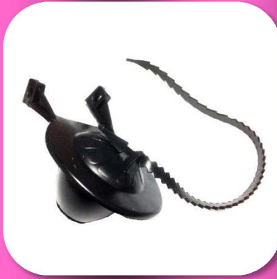
02-030 VALVULA SAPO PARA CONTRA DE WC 2" COLOR NEGRO BOLSA C/50 *MASTER 250 PIEZAS $14.60