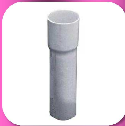
02-044 EXTENSION PARA FREGADERO 1 1/2" DE 20cm. PLASTICO