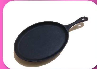
02-148 SARTENETA DE FIERRO VACIADO 10" *CAJA C/10 $103.50