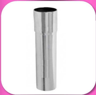
02-007 EXTENSION PARA FREGADERO 1 1/2" DE 15cm. FIERRO CROMADO