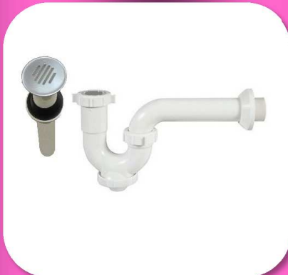
02-103 TRAMPA PARA LAVABO CON REGISTRO Y CONTRA CON REJILLA INOX. *BULTO 40 PIEZAS $56.50