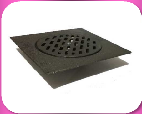
02-057 RESUMIDERO DE FIERRO VACIADO #8 COMPLETO *CAJA C/20 $108.00