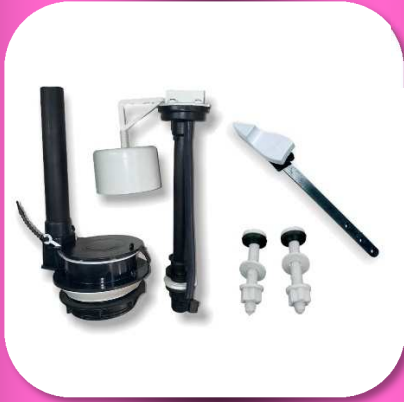
02-181 JUEGO DE HERRAJE PARA W.C. 3" PREMIUM *MASTER 15 PIEZAS $93.70