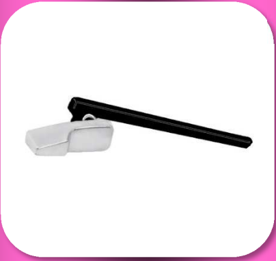
02-161 PALANCA PARA WC CROMADA CAJA C/40 PZAS *MASTER 240 PIEZAS $19.95