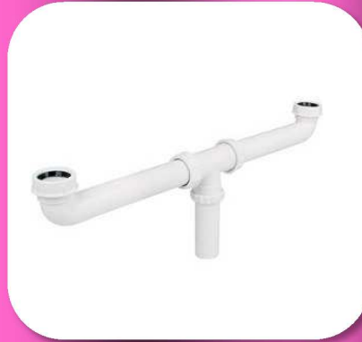
02-087 SALIDA CENTRAL DOBLE TARJA SIN TUBOS DE CEJA P/ FREGADERO *BULTO 45 PIEZAS $44.90