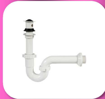
02-128 TRAMPA PARA LAVABO SIN REGISTRO *BULTO 50 PIEZAS $46.40