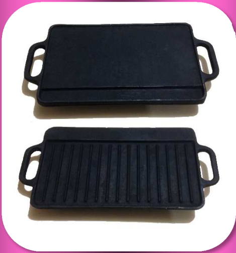
02-140 COMAL "DOBLE USO" DE FIERRO VACIADO 12 ½" *CAJA C/10 $152.00