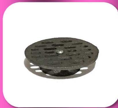
02-018 TAPA DE FIERRO VACIADO PARA RESUMIDERO #6 $32.50