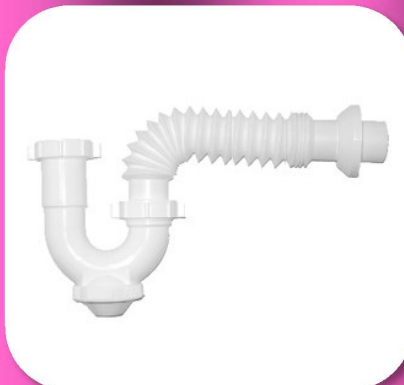
02-166 MEDIA TRAMPA PARA LAVABO O FREGADERO CON REGISTRO SALIDA FLEXIBLE *BULTO 60 PIEZAS $46.30