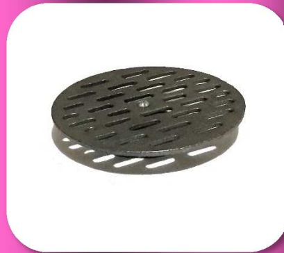
02-020 TAPA DE FIERRO VACIADO PARA RESUMIDERO #8 $54.00