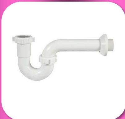
02-088 MEDIA TRAMPA PARA LAVABO O FREGADERO SIN REGISTRO *BULTO 70 PIEZAS $34.50