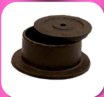
02-054 REGISTRO PARA BANQUETA DE FIERRO VACIADO *CAJA C/10 $48.00