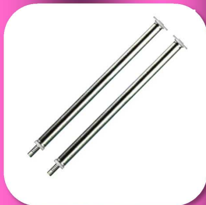
02-032 JUEGO DE PATAS PARA LAVABO 75cm. C/TORNILLOS NIVEL FIERRO CROMADO