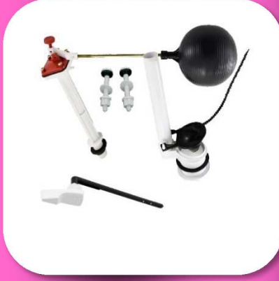
02-031 JUEGO DE HERRAJE CLASICO PARA W.C. 2" *BULTO 30 PIEZAS $89.30