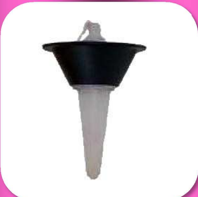
02-029 VALVULA PERA EXCELSIOR PARA CONTRA DE INODORO EN CAJA IND. *MASTER 180 PIEZAS $13.95