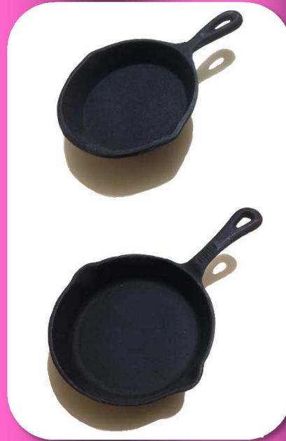
02-146 SARTEN CHICO DE FIERRO VACIADO 6" *CAJA C/10 $79.00