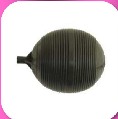
02-142 FLOTADOR 4" PARA SANITARIO DE PLASTICO COLOR NEGRO *BULTO 100 PIEZAS $4.80