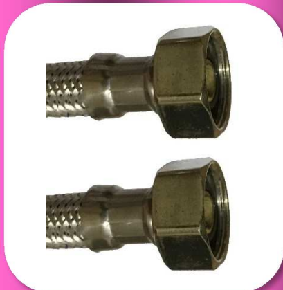
02-164 CONECTOR FLEXIBLE ECON ALUMINIO TUERCAS METALICAS 1/2" x 1/2" 55cm.