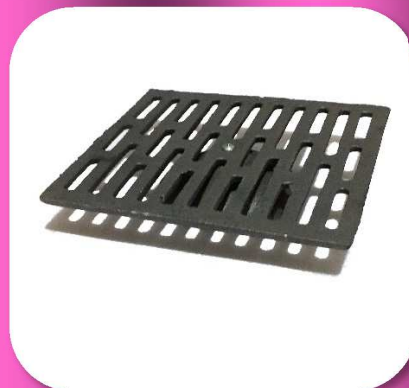
02-022 TAPA DE FIERRO VACIADO PARA RESUMIDERO #12 $133.50